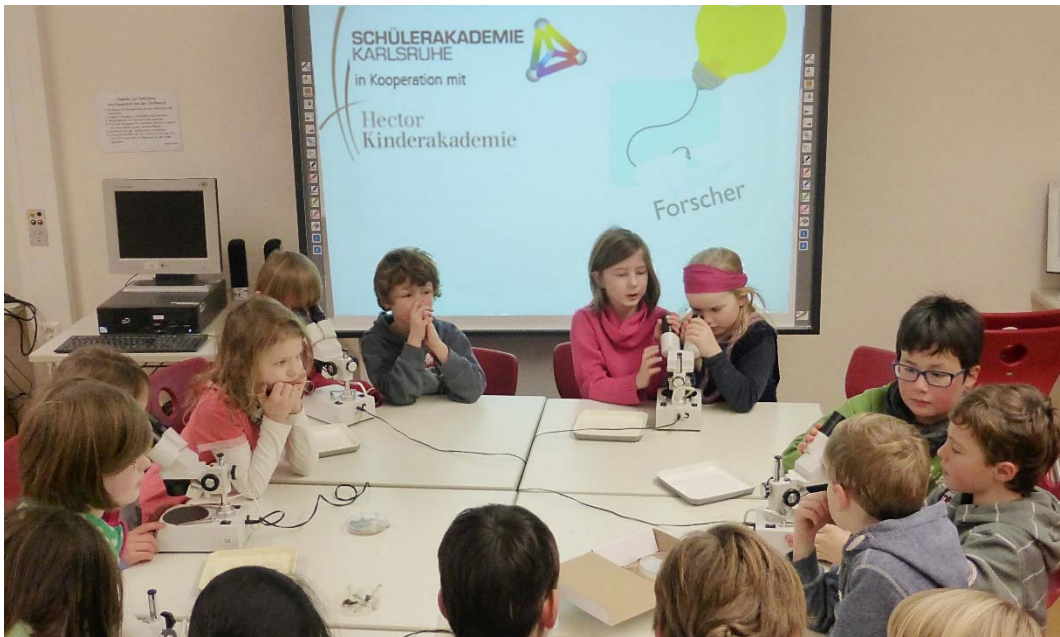
Abb1: Die Kinder des Projekts „Die Kinderforscher“ erhalten neue Mikroskope und Werkzeug für ihre Forschungen.